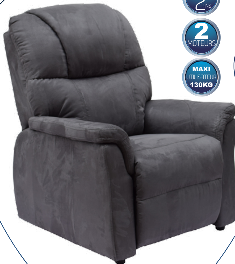
Télécommande fauteuil 2 moteurs.

Releveur 2 moteurs existant en finition mixte cuir (zones de contact) / revêtement enduit PU (flancs).