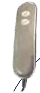
Télécommande fauteuil 1 moteur.