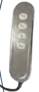
Télécommande fauteuil 2 moteurs.