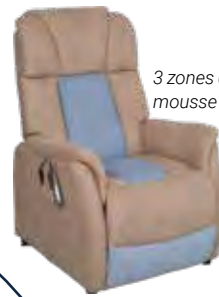
3 zones de portance en mousse à mémoire de forme

3 zones de portance à mémoire de forme pour ce releveur 2 moteurs et une zone d'assise incurvée pour plus de confort.